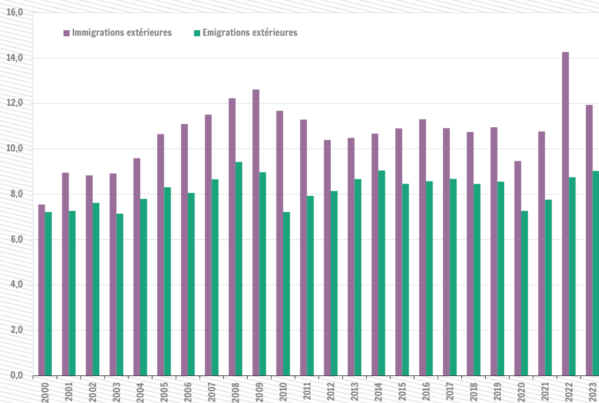
Migrations extérieures en Wallonie pour mille habitants (sans l'ajustement statistique)